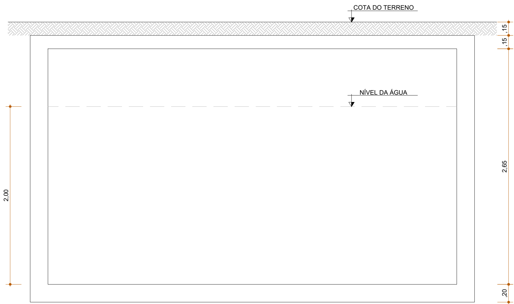
CORTE ESQUEMÁTICO ESCALA 1/25